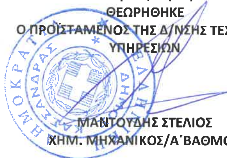
ΜΑΝΤΟΥΔΗΣ ΣΤΕΛΙΟΣ ΧΗΜ. ΜΗΧΑΝΙΚΟΣ/Α΄ ΒΑΘΜΟΥ

Ο ΠΡΟΪΣΤΑΜΕΝΟΣ ΤΗΣ Δ/ΝΣΗΣ ΤΕΧΝΙΚΩΝ ΥΠΗΡΕΣΙΩΝ