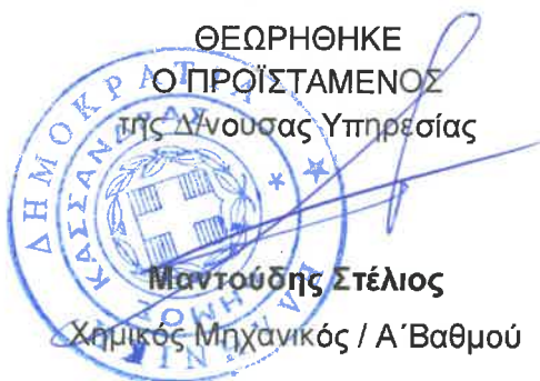
Μαντούδης Στέλιος Χημικός Μηχανικός / Α΄ Βαθμού