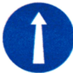
Ρ-49, 2 τεμ.