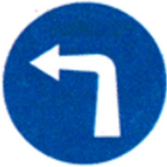
Ρ-50α, 2 τεμ.