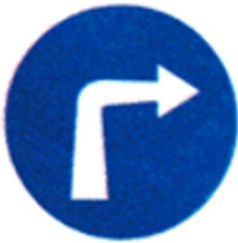
Ρ-50δ, 2 τεμ.