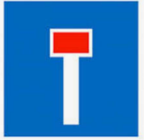
Π25, 6 τεμάχια

3 τεμάχια (τα ως άνω αναγραφόμενα χρονικά όρια είναι ενδεικτικά, στις προς τοποθέτηση πινακίδες θα πρέπει να αναγραφούν τα αντίστοιχα της ως άνω απόφασης). Οι εν λόγω πινακίδες τοποθετούνται στις θέσεις αποκλεισμού της κίνησης των Ι.Χ.