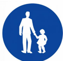
P-55, 5 τεμ.