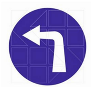
P-50α, 2 τεμ.