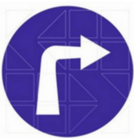
P-50δ, 2 τεμ.