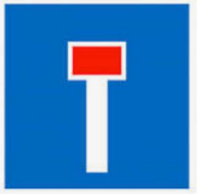
Π25, 5 τεμάχια

8 τεμάχια (τα ως άνω αναγραφόμενα χρονικά όρια είναι ενδεικτικά, στις προς τοποθέτηση πινακίδες θα πρέπει να αναγραφούν τα αντίστοιχα της ως άνω απόφασης). Οι εν λόγω πινακίδες τοποθετούνται στις θέσεις αποκλεισμού της κίνησης των Ι.Χ.